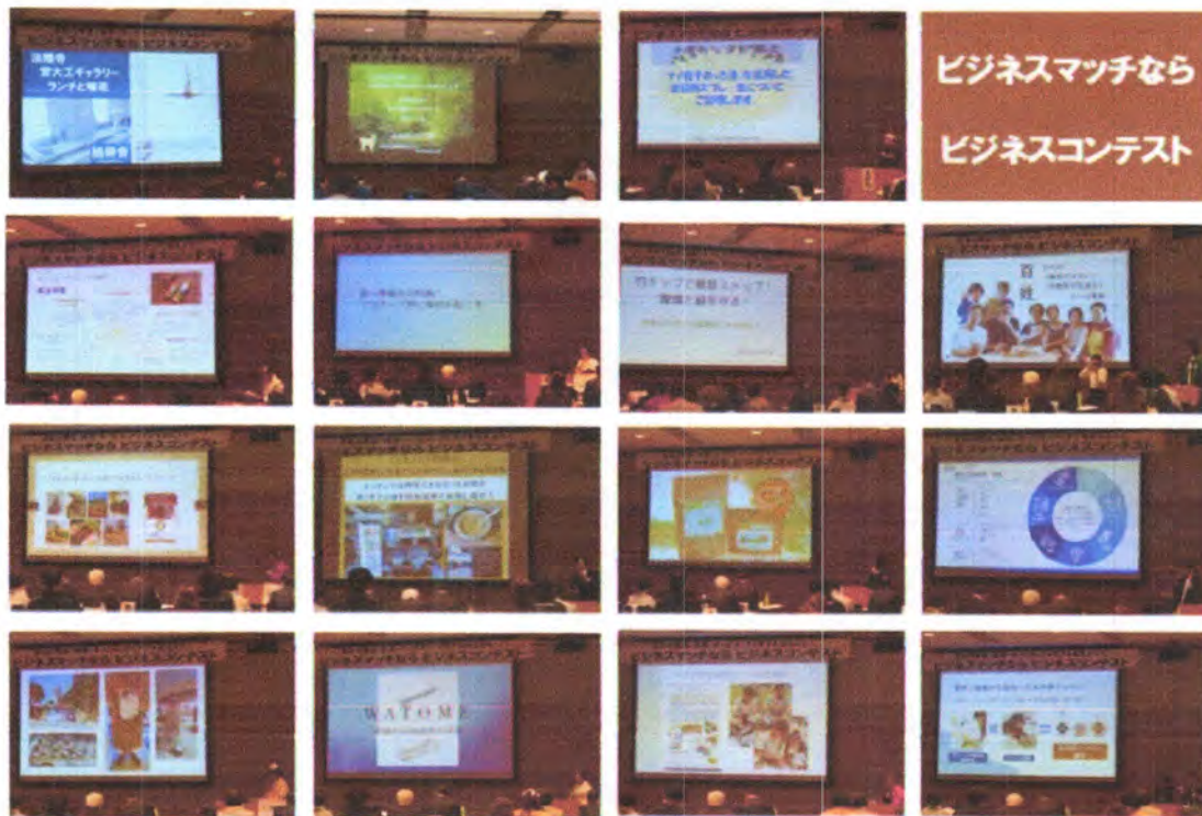
15社が創意工夫を発表

2024年12月5日(木)、奈良県商工会連合会主催の「自社の商品・技術・サービス・アイデアを伝えよう！ビジネスマッチなら ビジネスコンテスト」が奈良県コンベンションセンターにおいて行われました。奈良県内に拠点を置く15社が、日頃から創意工夫を重ねて生み出した、魅力ある商品やサービスをコンテスト形式で発表しました。